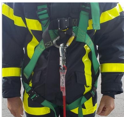
1-Port sur la veste textile et sur le surpantalonn